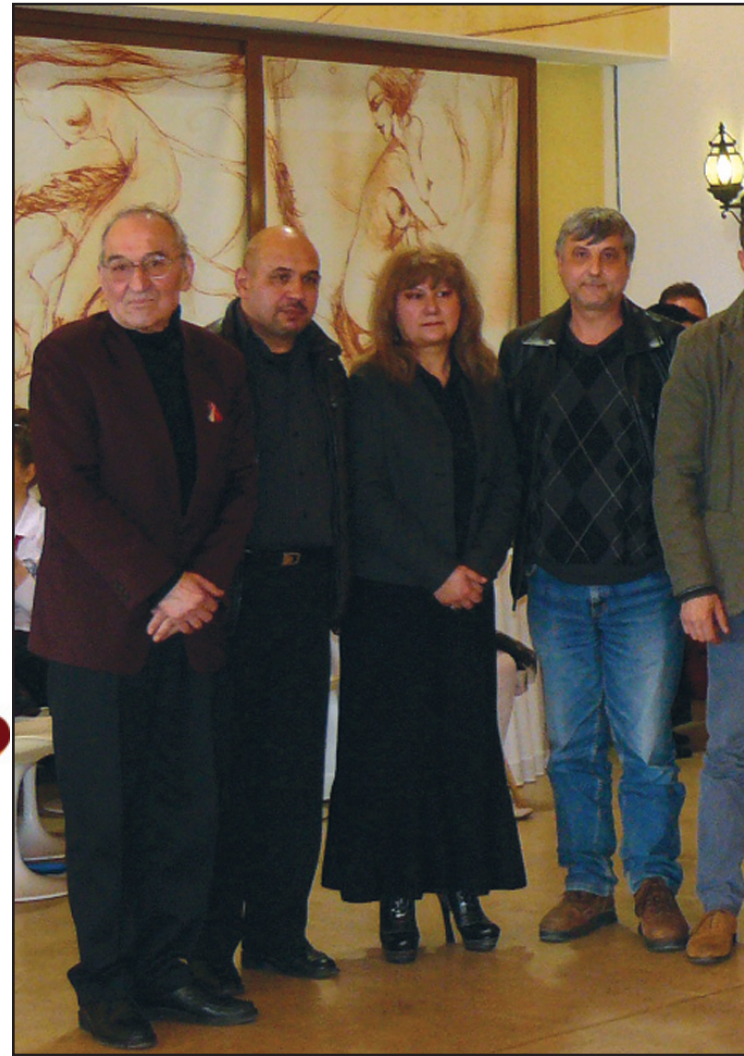
Лауреатите в тазгодишното издание заедно с